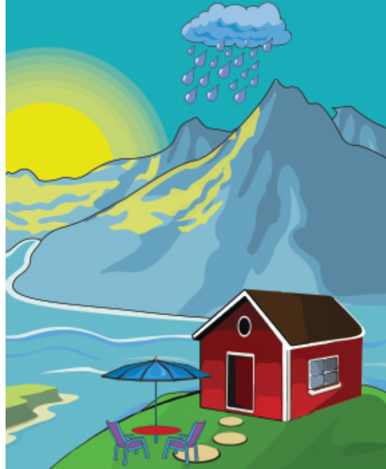
ماحول کی غیر جاندار اشیا