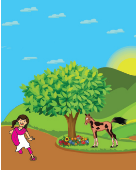
ماحول میں پائے جانے والے جاندار

ہماری زمین خشکی اور پانی پر مشتمل ہے۔ زمین کے زیادہ حصے پر پانی ہے۔ خشکی والے حصے پر کہیں پہاڑ ہیں تو کہیں صحرا اور کہیں ہرے بھرے کھیت۔ ہم جس جگہ پر رہتے ہیں اس کے ارد گرد کی چیزیں ہمارا ماحول کہلاتی ہیں۔ ان چیزوں میں انسان، جانور اور پودے وغیرہ جاندار ہیں اور میدان، پہاڑ، دریا، دیواریں، کرسی اور میز وغیرہ غیر جاندار ہیں۔